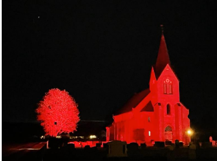
Ingvar Emdal 24. oktober kl. 19:12 · 📍

Verdens polioidag 24.10. Ver med å bidra til å vaksinere barn mot polio .vipps 114274. For kr100 vaksinerer vi 17 barn. Takk for ditt bidrag.